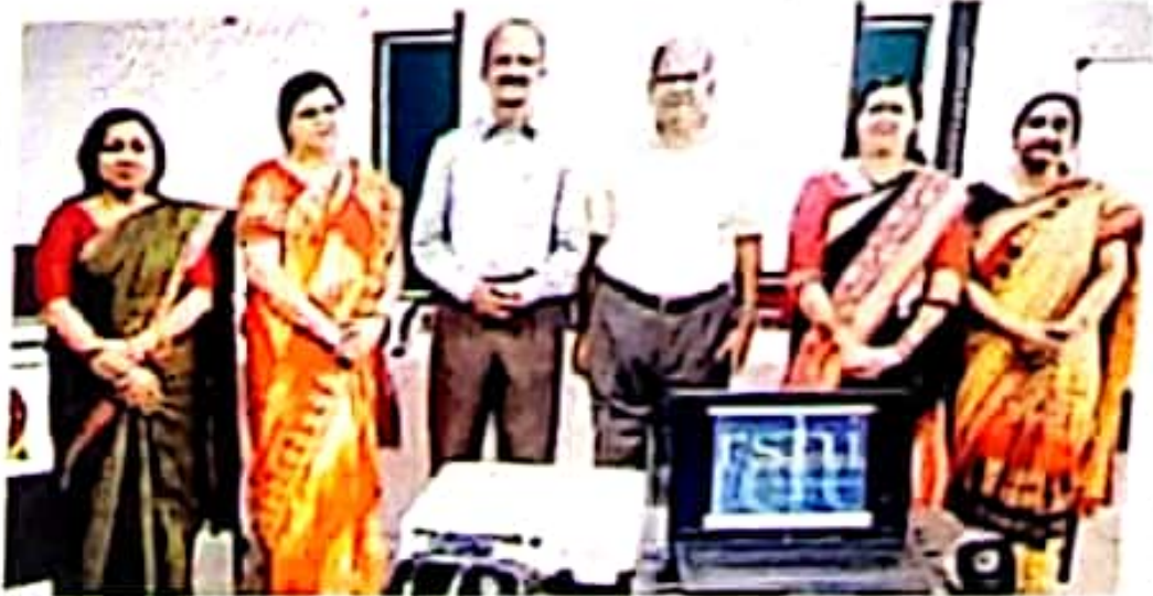
गणराज्य के फैक्ट्री क्षेत्रों में बिजली टोपी के रूप में जाना जाता है।

प्रतिष्ठित हैकल्पना के तहत एक टोपी के क्षेत्र में इतिहासी विद्युत है। यह क्षेत्र को विद्युत विद्युत या बिजली के रूप में जाना जाता है।