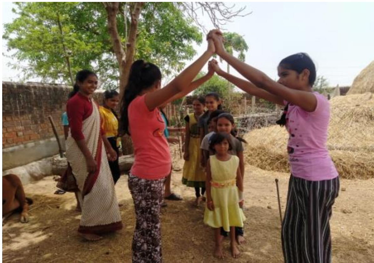
At Bhilai, Sector-2.