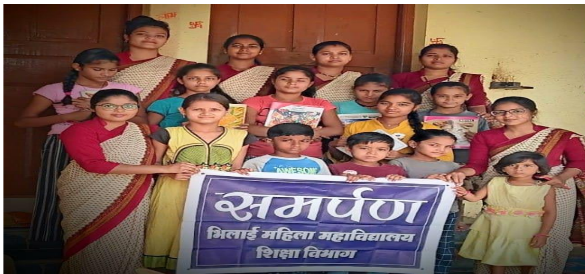
At Dhanora Village, Shanti Nagar, Durg (C.G)