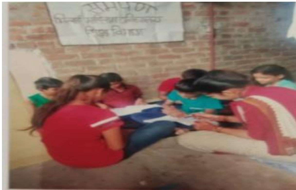
AT JABALPUR (M.P)