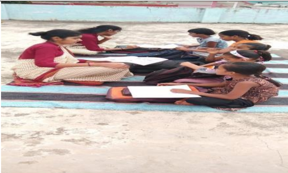
AT KHURSIPAR BHILAI

2. To develop and improve social needs by caring and curing problems of the children