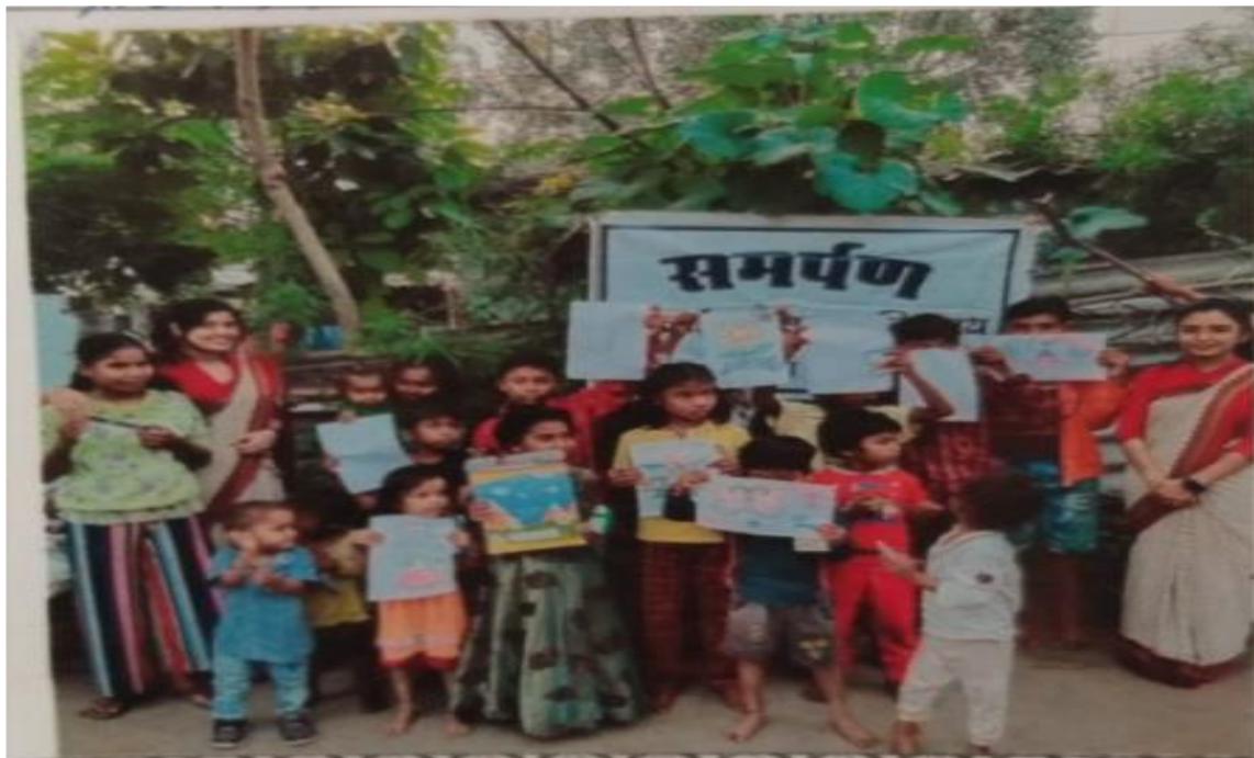
AT RISALI, BHILAI