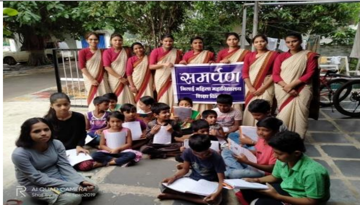
AT TIRTURDIHI DURG (C.G)