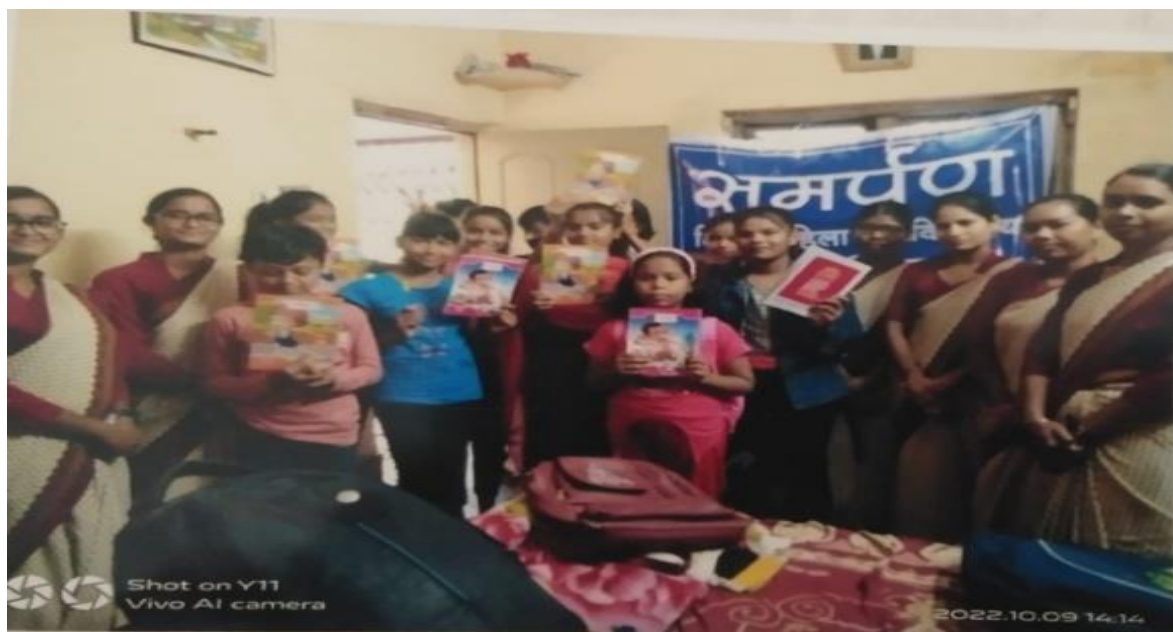
At Hudco, Bhilai.