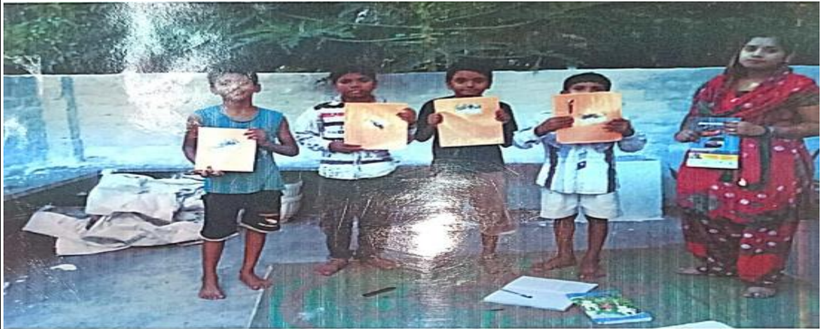
AT JORATORAI, GUNDERDEHI BALOD (C.G)