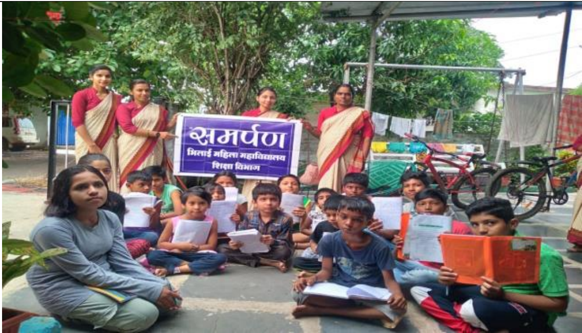
At Bhilai, Sector-5

2. To develop and improve social needs by caring and curing problems of the children