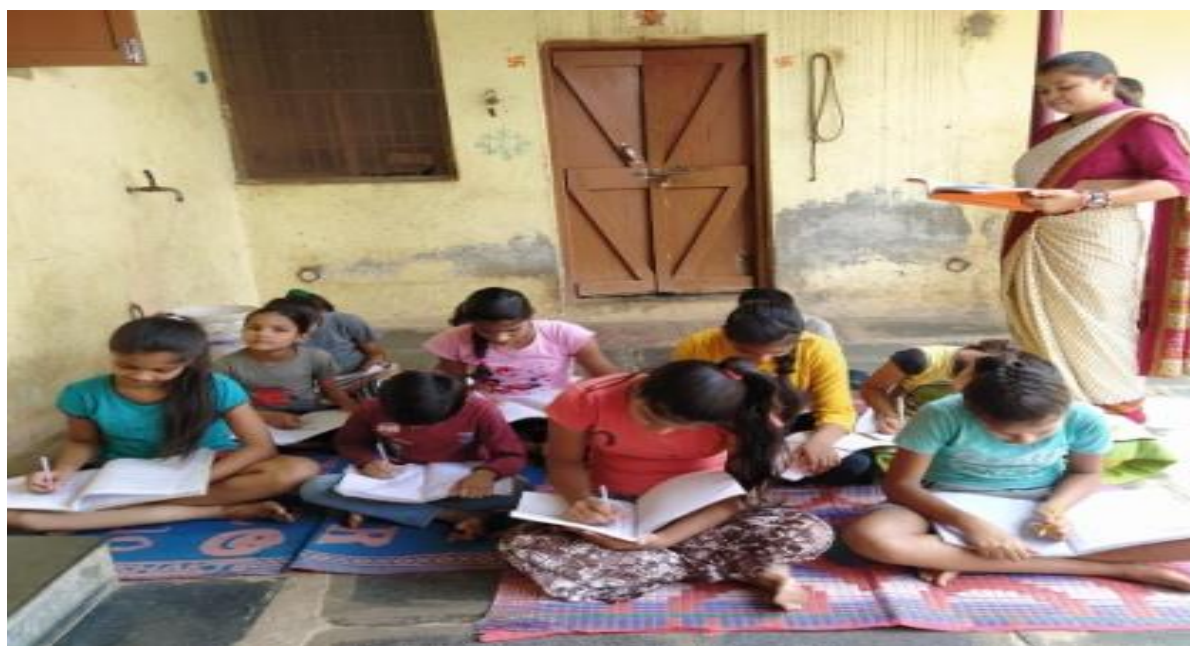
At Kasaridhi , Durg (C.G)